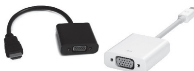
他コネクター接続用変換アダプター例 (Mac、HDMI)